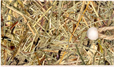
Dieser Ausgabe liegt ein exklusives Muster „Wildspitze auf Flachsvlies“ bei, das auch als Lesezeichen verwendet werden kann.