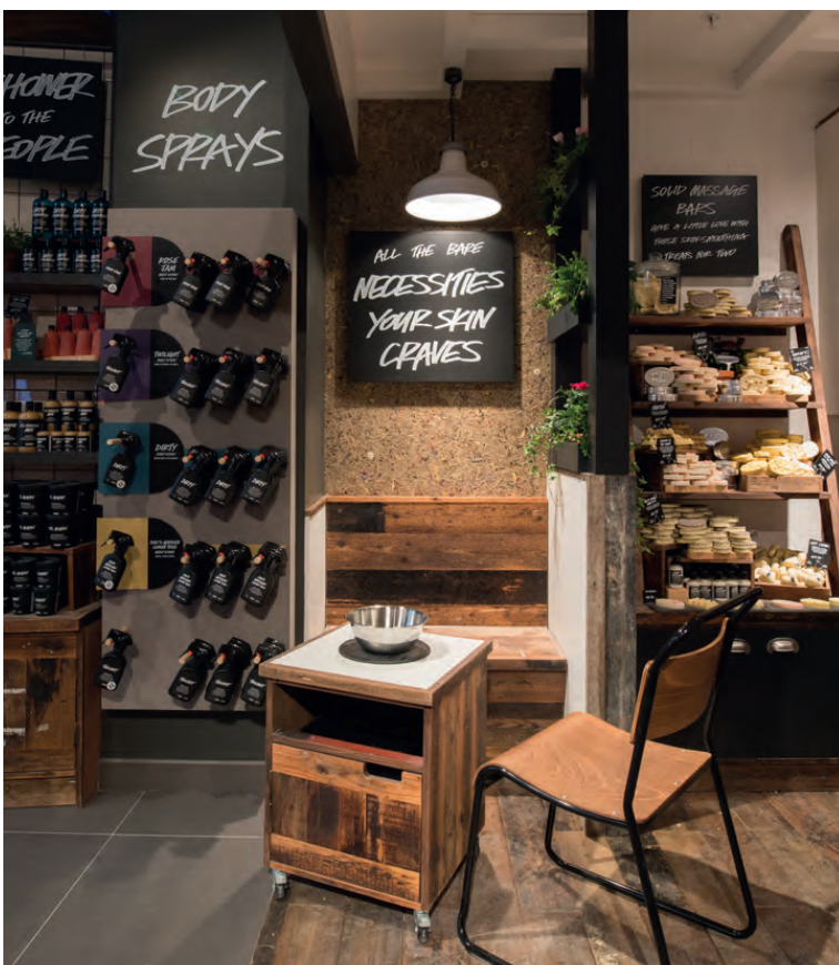
Auf der Euroshop 2020 präsentierten Vizona GmbH, Ansorg GmbH und Visplay GmbH ein besonderes Ladenbaukonzept mit Organoid-Naturoberflächen.

Der Einsatz von Organoid-Produkten ist auch immer ein Statement für Natürlichkeit: Der Londoner „Lush“-Store hat in sein Ladendesign die Oberfläche „Almwiesen“ integriert.