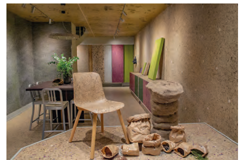
„Pieces of Green Materials“: Der Organoid-Showroom in Stockholm wurde komplett aus Organoid gestaltet und zeigt die gesamte Produktvielfalt.

einzigartiges Raum- und Einkaufserlebnis. Die Oberflächen werden standardmäßig unbehandelt geliefert. So ist gewährleistet, dass die natürlichen Eigenschaften des Rohmaterials wie Duft, Haptik und Optik weiterhin erlebbar bleiben. Für den Einsatz in Objekten, die eine besonders hohe Abrieb-, Wasser- oder Kratzfestigkeit der Wände und Oberflächen verlangen, kann das Naturmaterial mit herkömmlichen Ölen und Lacken versiegelt oder mit einer Epoxy-Schicht überzogen werden. Dank der Mindestabnahmemenge von nur wenigen Quadratmetern und dem generell hohen Individualisierungsgrad in der Fertigung lassen sich die klimaneutral produ-