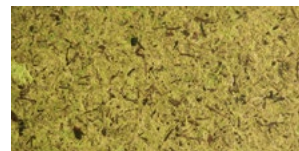
MOUS* MOOS GRÜN EINGEFÄRBT

» ORGANOID® FLEXI bietet sich überall dort an, wo es auf dünnes, flexibles Trägermaterial ankommt. Diese Oberflächen sind Sonderanfertigungen - Rohmaterialien können entsprechend den Wünschen nach Farbe und Herkunft frei gewählt werden. Kein Lagerbestand, Lieferzeit auf Anfrage.