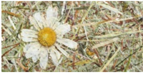
WILDSPITZE MARGERITTA* ALMHEU MIT MARGERITEN