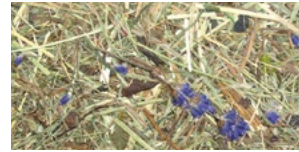
WILDSPITZE LAWENDL* ALMHEU MIT LAVENDEL