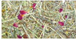
WILDSPITZE ROASA* ALMHEU MIT ROSENBLÜTEN