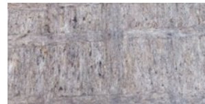
WOLLÄ WOLLE VOM TIROLER BERGSCHAF