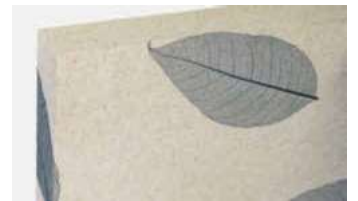
/ So verbinden sie Naturnähe mit beruhigender Raumakustik.