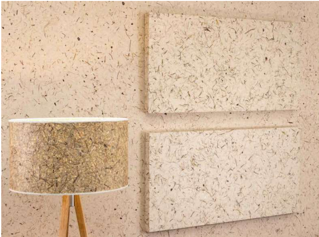
/ Die Bildabsorber von Organoid werden aus recycelten Plastikflaschen im Upcycling-Prozess hergestellt und anschließend mit den bekannten natürlichen Oberflächen auf Flachsvlies veredelt. Im Bild: Wildspitze light besteht aus Almgräsern und -kräutern.